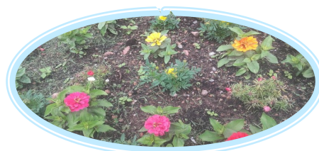
Ça pousse et ça fleurit !