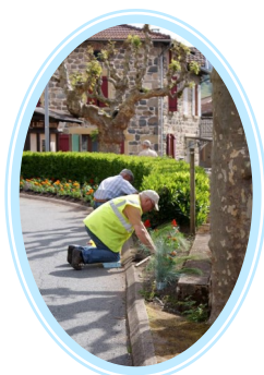
En plein travail !

À 9h30, bénévoles, employés et conseillers étaient prêts pour embellir notre village. Ils ont mis en place 1500 plants répartis dans 5 massifs, une soixantaine de jardinières et une dizaine de bacs avec géraniums, zinnias, lobelias, sauges, bégonias et œillets d'inde.