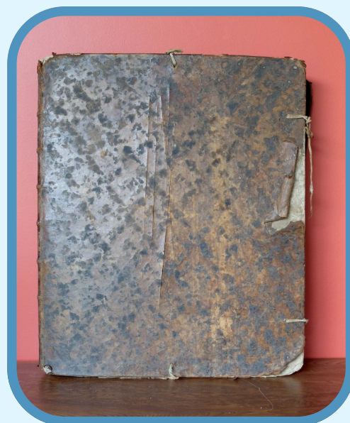
Livre « terrier » de 1778