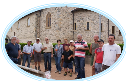
Après l'effort, le réconfort !