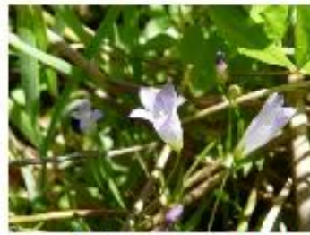
La wahlenbergie à feuilles de lierre