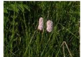
La renouée bistorte

Anne FIMBEL – Guide de pays à Poule les Echarmeaux