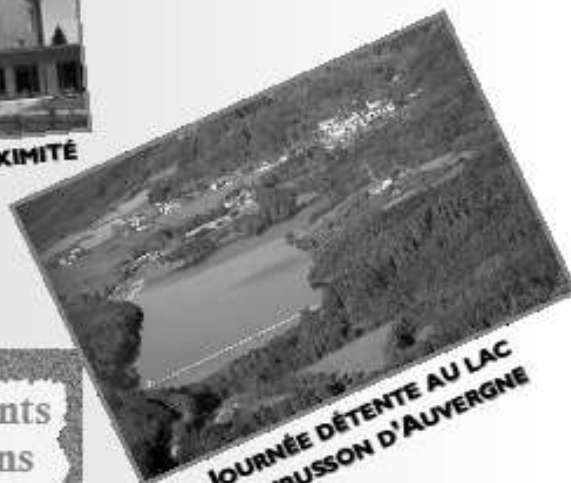
JOURNÉE DÉTENTE AU LAC D'AUBUSSON D'AUVERGNE

Renseignements et Inscriptions Jusqu'au 29 mars 04 74 04 73 87