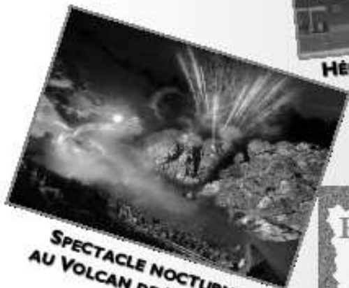
SPECTACLE NOCTURNE AU VOLCAN DE LEMPTÉGY