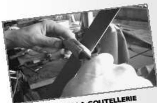
VISITE DE LA COUTELLERIE ROBERT DAVID À THIERS

SORTIE ORGANISÉE PAR VIVRE EN HAUT BEAUJOLAIS ET LE SECOURS CATHOLIQUE DE LAMURE /A. TRANSPORT EN CAR (DÉPART DE MONSOLS ET LAMURE/AZERGUES) ENFANTS OBLIGATOIREMENT ACCOMPAGNÉS