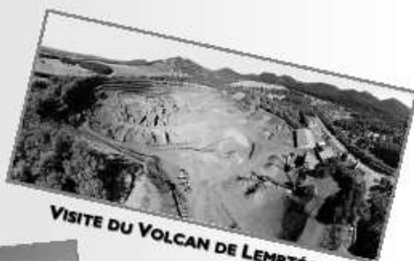
VISITE DU VOLCAN DE LEMPTÉGY