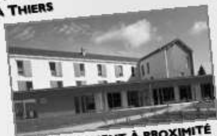
HÉBERGEMENT À PROXIMITÉ